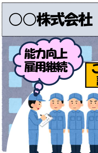
ご依頼いただく企業様

企業様にご希望される 訓練内容について 専門の講師を 無料 で 選任・紹介・派遣 いたします！