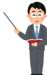
ご希望の訓練内容 に添う講師